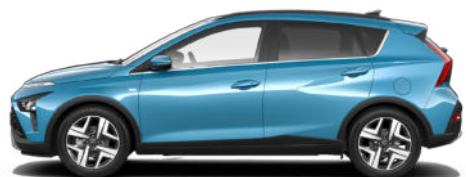
Aqua Turquoise Metallic