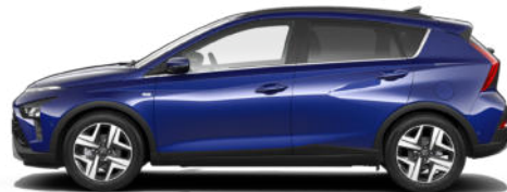
Intense Blue Pearl Kontrastdach verfügbar