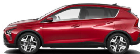
Dragon Red Pearl Kontrastdach verfügbar