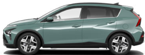
Mangrove Green Pearl Kontrastdach verfügbar