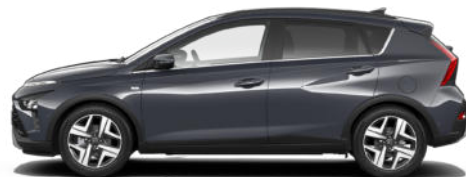
Aurora Gray Pearl